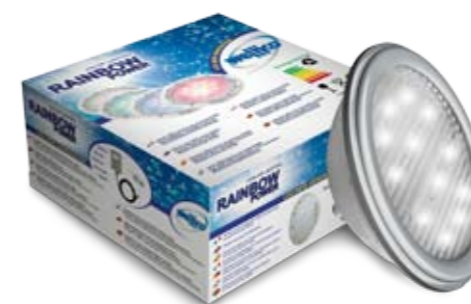
DIAMOND POWER (blanc)