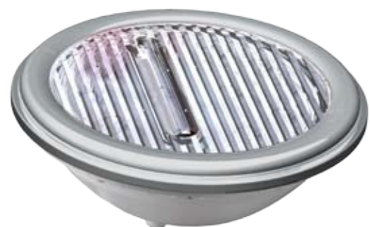
Détail de l'optique: Concentrateur de faisceaux