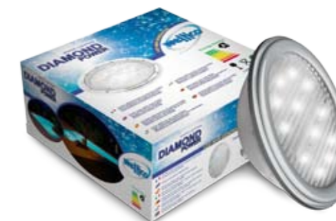
RAINBOW POWER (couleurs)